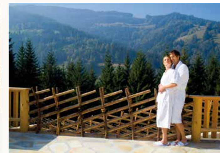
Genießen Sie ein Farbenspiel der besonderen Art.