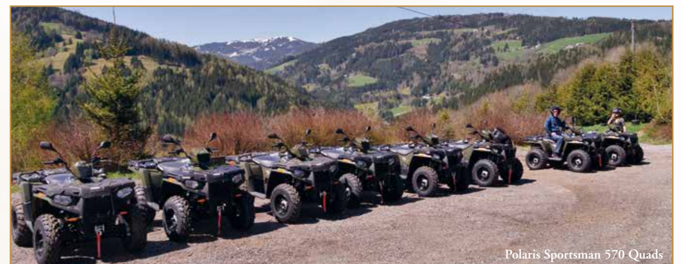
Polaris Sportsman 570 Quads