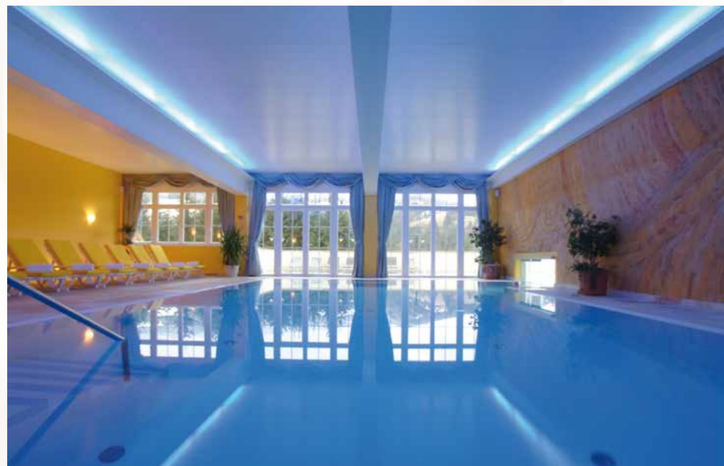
Panoramahallenbad mit Colorama, Sternenhimmel und Massagedüsen.